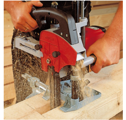
LS 103 Ec с направляющей стойкой FG 150 глубина выборки 140 мм.