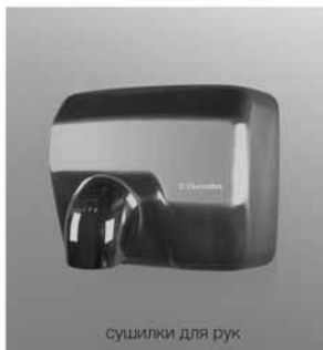
сушилки для рук