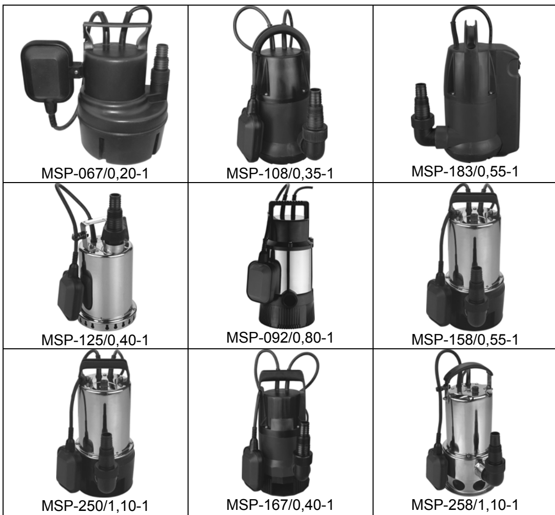
Рис. 1. Общий вид насосов погружных дренажных

ВНИМАНИЕ! Запрещено применять насосы для перекачивания горючих жидкостей типа мазута, топлива или аналогичных жидкостей.