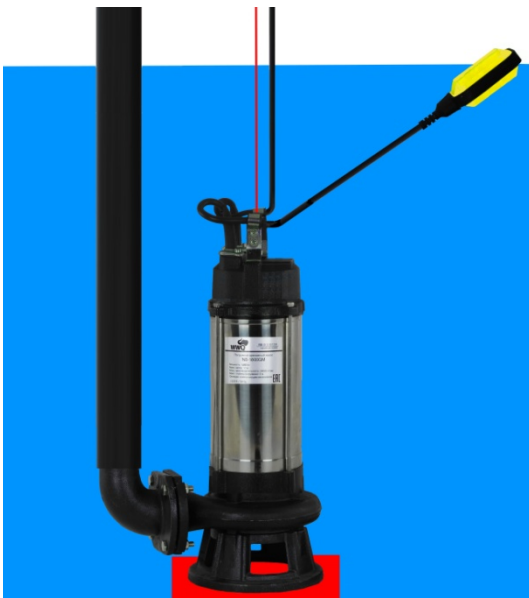
Уровень включения насоса