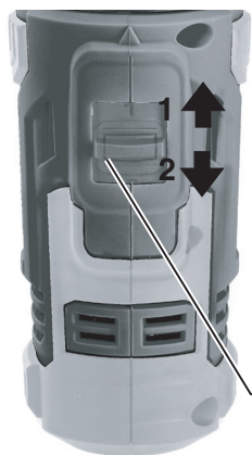
Рычаг регулировки диапазона скоростей

Ваш электроинструмент оснащен двухскоростным редуктором с возможностью выбора оптимального диапазона скоростей.