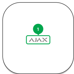
1 - Логотип со световым индикатором