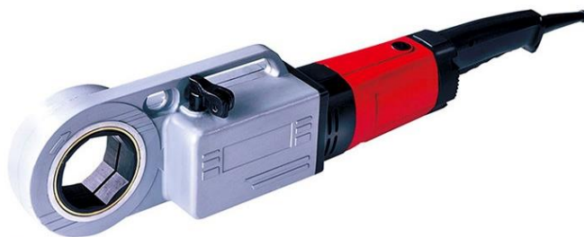
Рисунок 2. Клупп SQ30-B до 2"