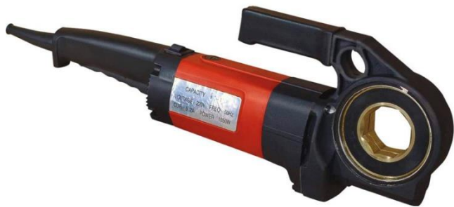
Рисунок 1. Клупп SQ30 до 1,25"