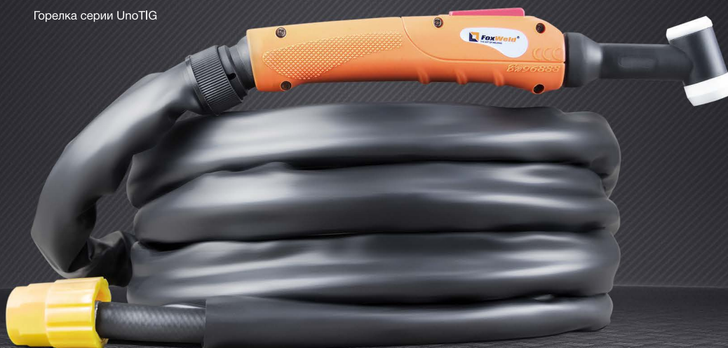
Горелка серии UnoTIG

Внешний вид комплектующих отличается в зависимости от модели используемой горелки.