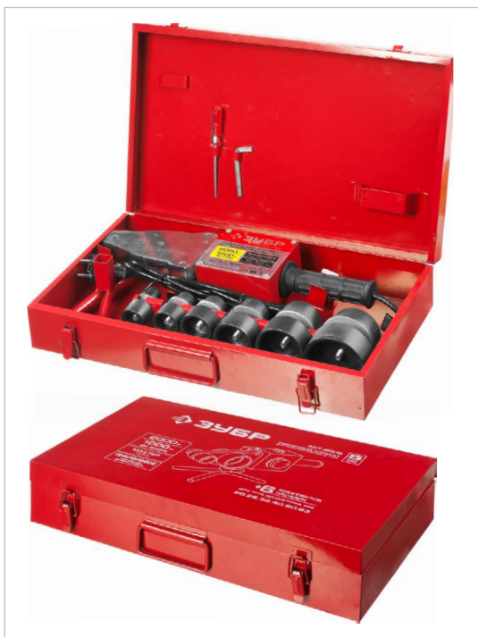
Металлический кейс для удобства хранения