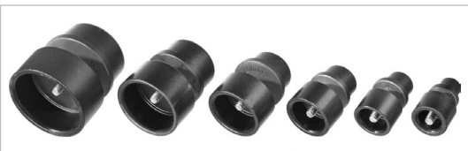
Тefлоновые нагревательные насадки для труб диаметром 20, 25, 32, 40, 50, 63 мм