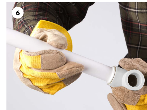
6 Время соединения и охлаждения должны точно соблюдаться (см. таблицу режимов сварки)