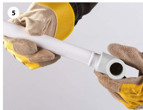
5 Быстро вставьте нагретую трубу в фитинг