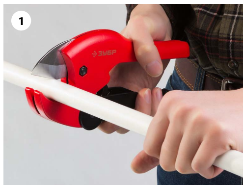
1 Отмерьте необходимую длину и отрежьте трубу строго перпендикулярно