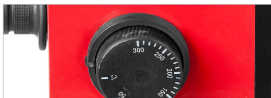
Регулятор для точной настройки рабочей температуры