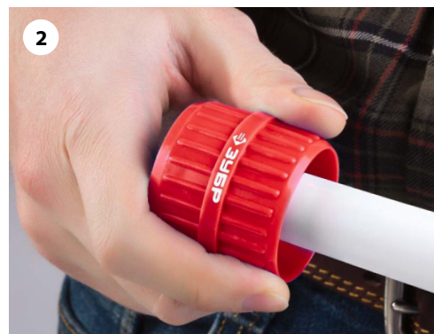
2 Зачистите торец трубы