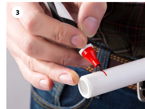
3 Нанесите метку на расстоянии равном глубине фитинга плюс 2 мм от торца трубы