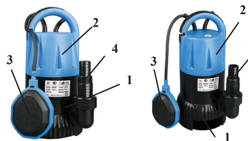
НПС - ***/5П

4.1 Общий вид насоса схематично представлен на рис.1