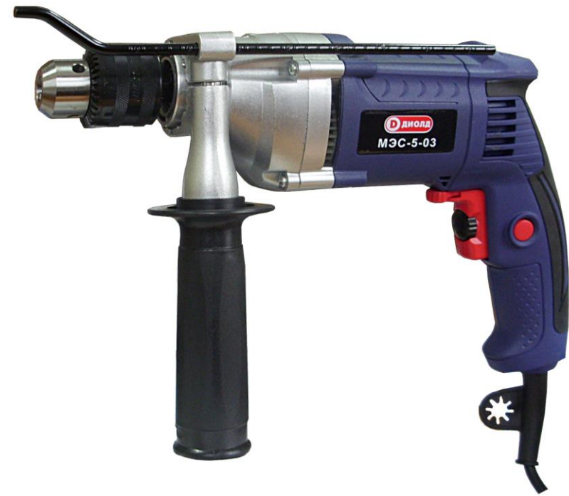
Машина ручная электрическая сверлильная МЭС-5-03 (Арт. 10011050)

РОССИЯ 214031 г. СМОЛЕНСК ул. ИНДУСТРИАЛЬНАЯ - 2 ЗАО "ДИФФУЗИОН ИНСТРУМЕНТ" Вопросы по гарантии: тел/факс (4812) 31-73-85 тел. 31-80-29 Отдел сбыта: тел/факс (4812) 61-15-48, 55-30-92