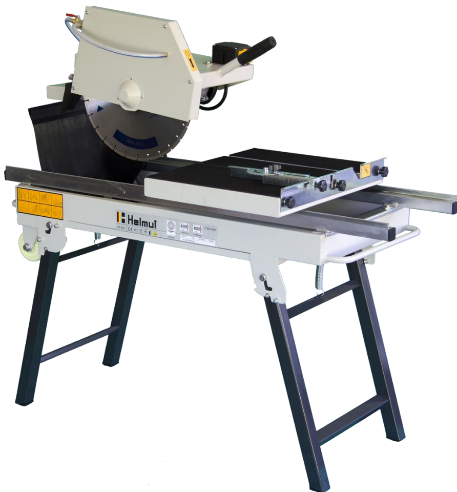
Рисунок 2 – Станок камнерезный серии ST/N

Станки камнерезные серии ST/N включает в себя все необходимое для начала работ. Отличаются от станков ST наличием усиленной рамы, крепких опор, поставляются в 9 различных вариантах с длиной реза 800, 900, 1000мм, а также дисками 350, 400, 450 метров.