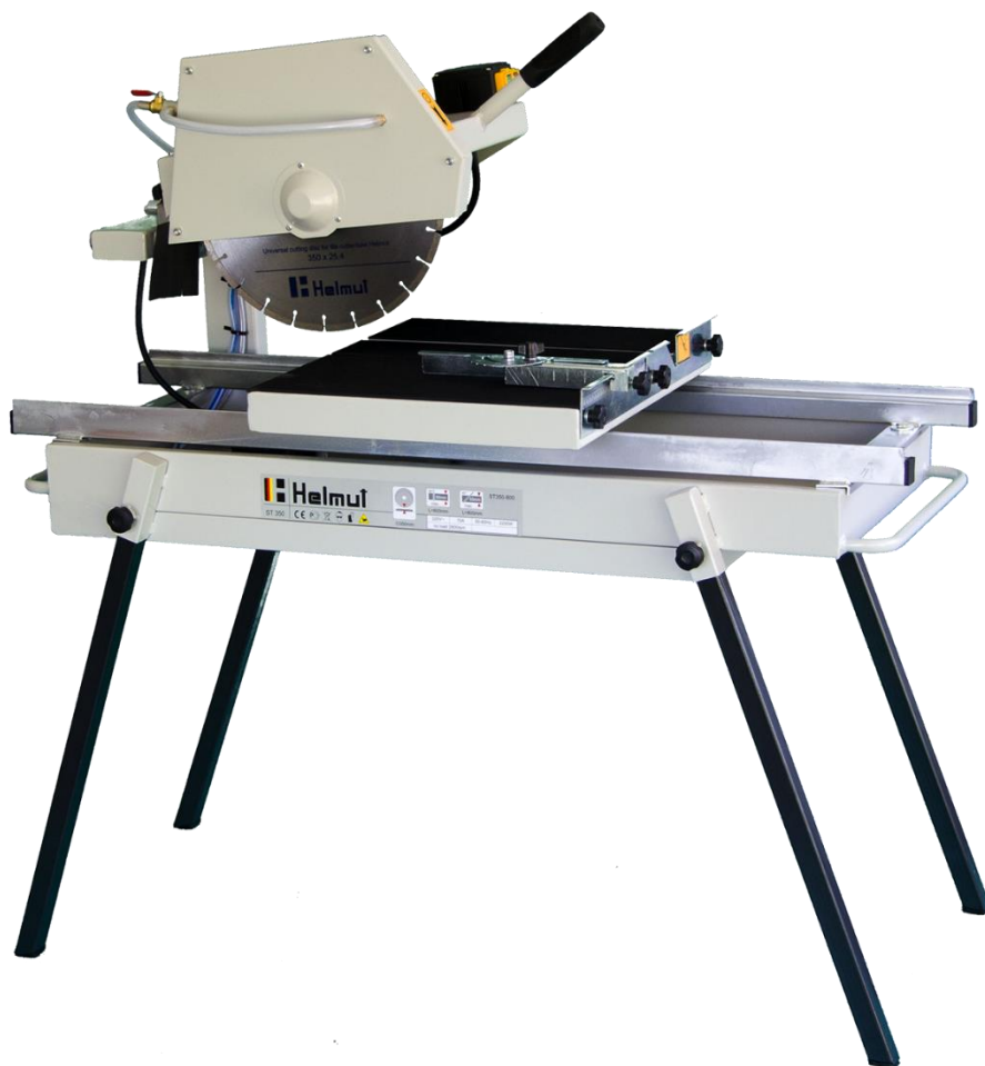
Рисунок 1 – Станок камнерезный серии ST

Станок камнерезный электрический FS300 предназначен для резки керамогранитной и тротуарной плитки, кровельной черепицы, гранита, базальта, мрамора, бордюрного и дорожного камня, строительных бетонных и газобетонных блоков.