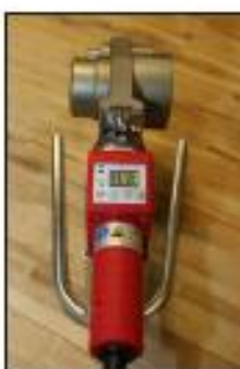
ROWELD P 63 Set