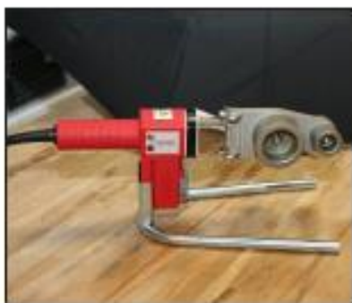
ROWELD P 40 Set