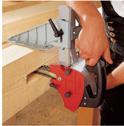
LS 103 Ec в горизонтальном позиционировании.