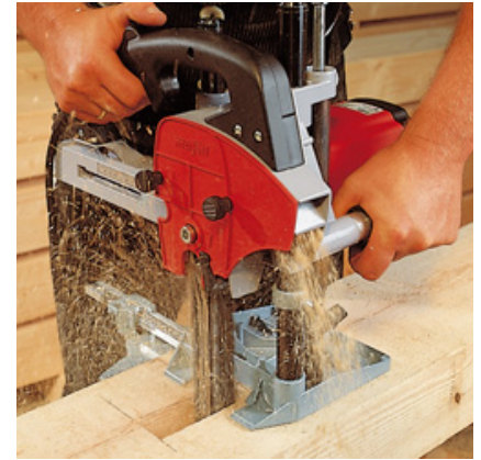
LS 103 Ec с направляющей стойкой FG 150 глубина выборки 140 мм.