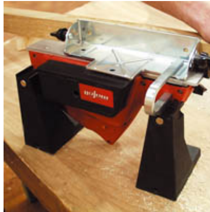
Использование рубанка MHU 82 в качестве строгального станочка. В комплект устройства входит и маятниковый защитный кожух.