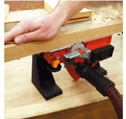
Стружки просто отсасываются.