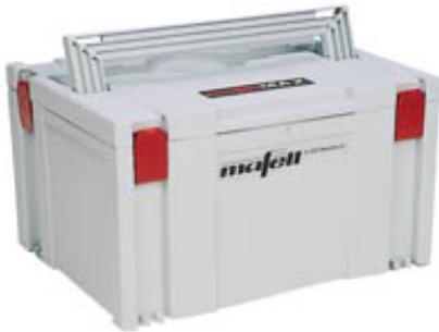
Ручной рубанок MHU 82 в комплекте в прочном и удобном кейсе MAFELL-MAX. № заказа 912714