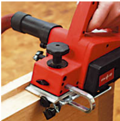
Фальцевание двери ручным рубанком MHU 82.