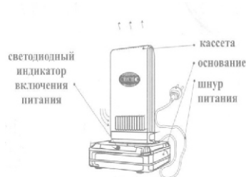
Рис.1. Общий вид воздухоочистителя

Прибор состоит из 2 частей: основания, в котором расположен электронный блок питания, и легкосъемной кассеты. Внутри кассеты размещены ионизирующий узел и осадительные электроды, образующие очистную камеру. Рабочее положение прибора - вертикальное. Работа прибора основана на принципе "ионного ветра", который возникает в результате коронного разряда и обеспечивает движение потока воздуха через кассету прибора, при этом насыщаются ионами частицы аэрозоля (пыль, дым, микроорганизмы), загрязняющие воздух, всасываются вместе с воздухом в кассету приобретающая электрический заряд и под действием электростатического поля "прилипают" к осадительным пластинам, расположенным внутри кассеты. Одновременно происходит дополнительная наружная очистка воздуха. Аэрозольные, то есть взвешенные в воздухе, не прошедшие через очистную камеру частицы, взаимодействуют с отрицательными ионами и приобретают отрицательный заряд. Эти частицы притягиваются положительно заряженными поверхностями (это может быть пол, стены, экран телевизора). В результате происходит дополнительная очистка воздуха, а влажную уборку поверхностей рекомендуется проводить чаще.