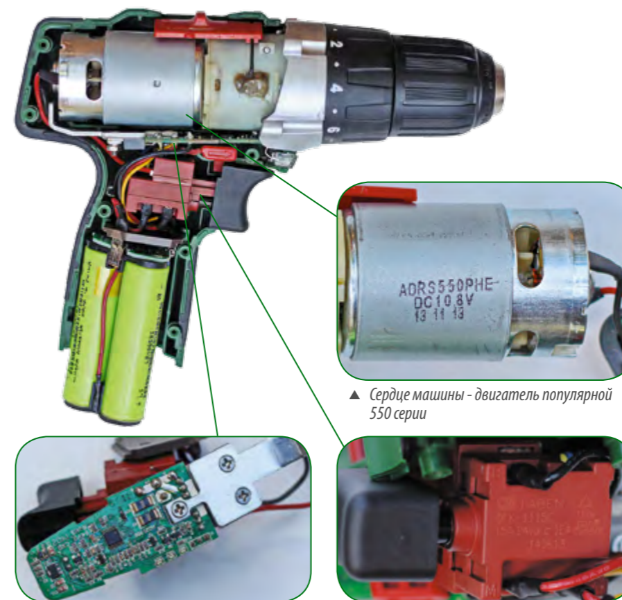
▲ Сердце машины - двигатель популярной 550 серии