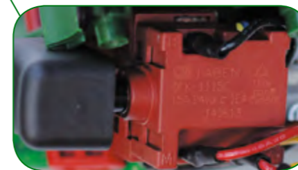
▲ Кнопка выключателя производства JIABEN