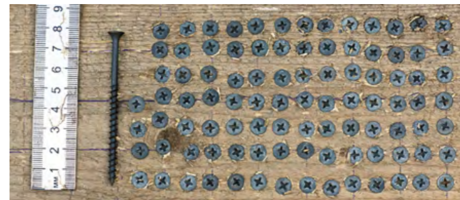
▲ В тесте на «выносливость» мы использовали саморез 4,2x80 мм, вкручивая крепеж в сосновый брус. Осиленный шуруповертом объем составил 95 вкрученных саморезов.