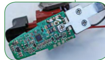
▲ Управляющая электроника