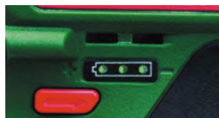
▲ Трехступенчатый индикатор заряда батареи

Напряжение аккумуляторного блока при максимальном заряде составило 12,28 В. Защита батареи от полного разряда срабатывает на 9,24 В (по 3,08 В на банку), что вполне допустимо и положительно скажется на долговечности. При полном заряде батареи инструмент на холостом ходу проработал 52 минуты и при скорости 350 об/мин, совершил ~18200 оборотов.