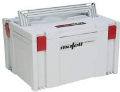
Фрезер LO 50 E поставляется в удобном кейсе MAFELL-MAX.