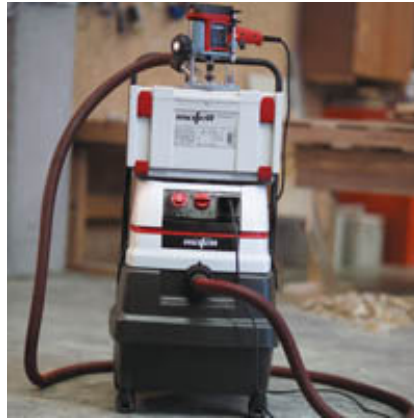
Чистая работа! Фрезер LO 50 E в тандеме с пылесосом S 50 M от MAFELL.