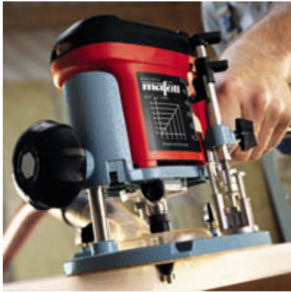
Профилирование кромки фрезой с опорным кольцом